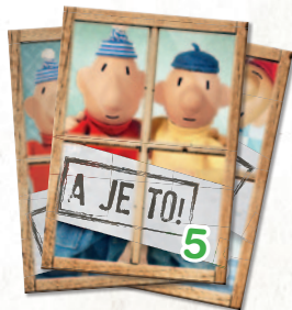
3 'A JE TO!'-kaarten